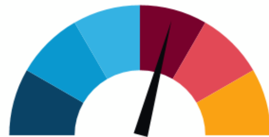
Segundo Corte 30%