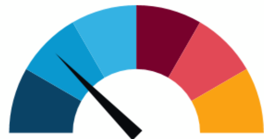
Primer Corte 30%